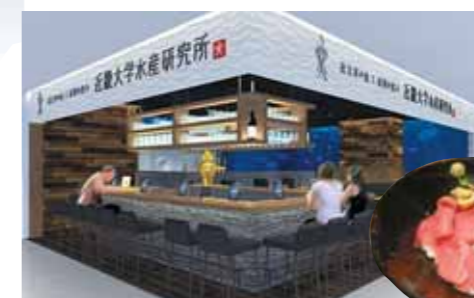
6F「近畿大学水産研究所」近大産の完全養殖マグロが食べられます！