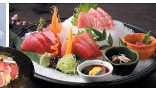
写真は本マグロ三味お造り盛り 2,800円(税込) 本まぐろ漬け丼やお刺身ご膳などメニューも豊富。