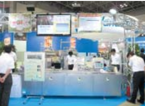
<播潰機&ボールカッター>