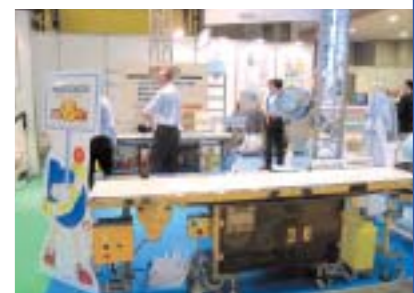
▲アンベルと▼バイルック（定価98,000円）

（本社）山口県周南市清水2丁目3-7 TEL 0834-62-2575 FAX 0834-62-4283