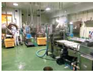
原料処理工程と成型加熱工程が同室で結ばれました