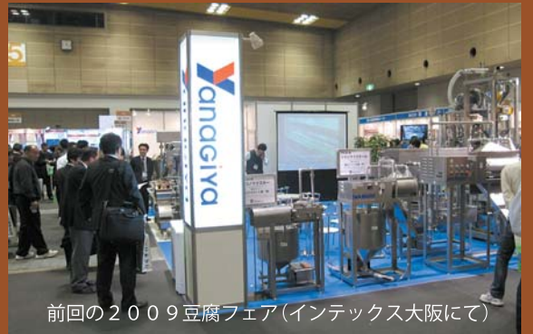
前回の2009豆腐フェア(インテックス大阪にて)