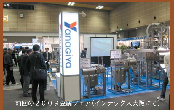
前回の2009豆腐フェア(インテックス大阪にて)