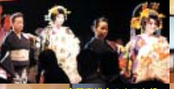
全蒲青総会のホスト役、 北海道ブロックの皆さん