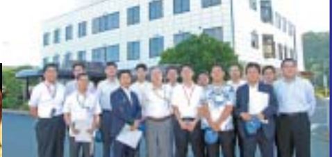
9/14 オプションツアー ヤナギヤ工場見学