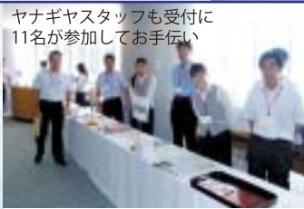
ヤナギヤスタッフも受付に 11名が参加してお手伝い